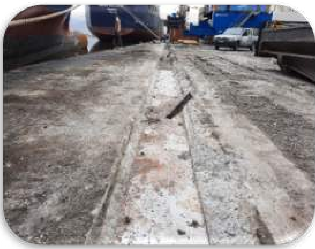
-Démolition du béton-