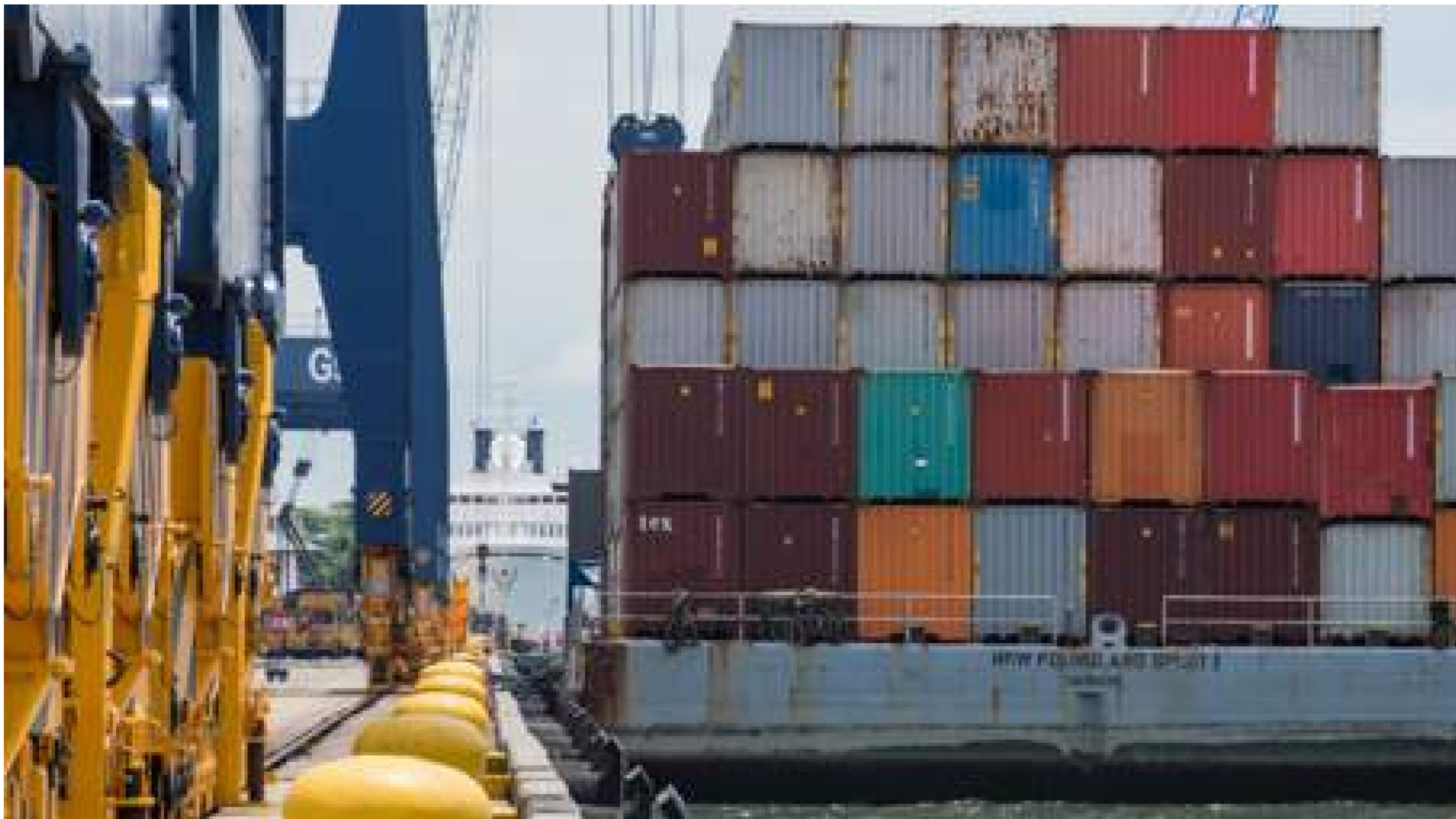
Transfert de conteneurs dans le port de Cartagena, en Colombie.