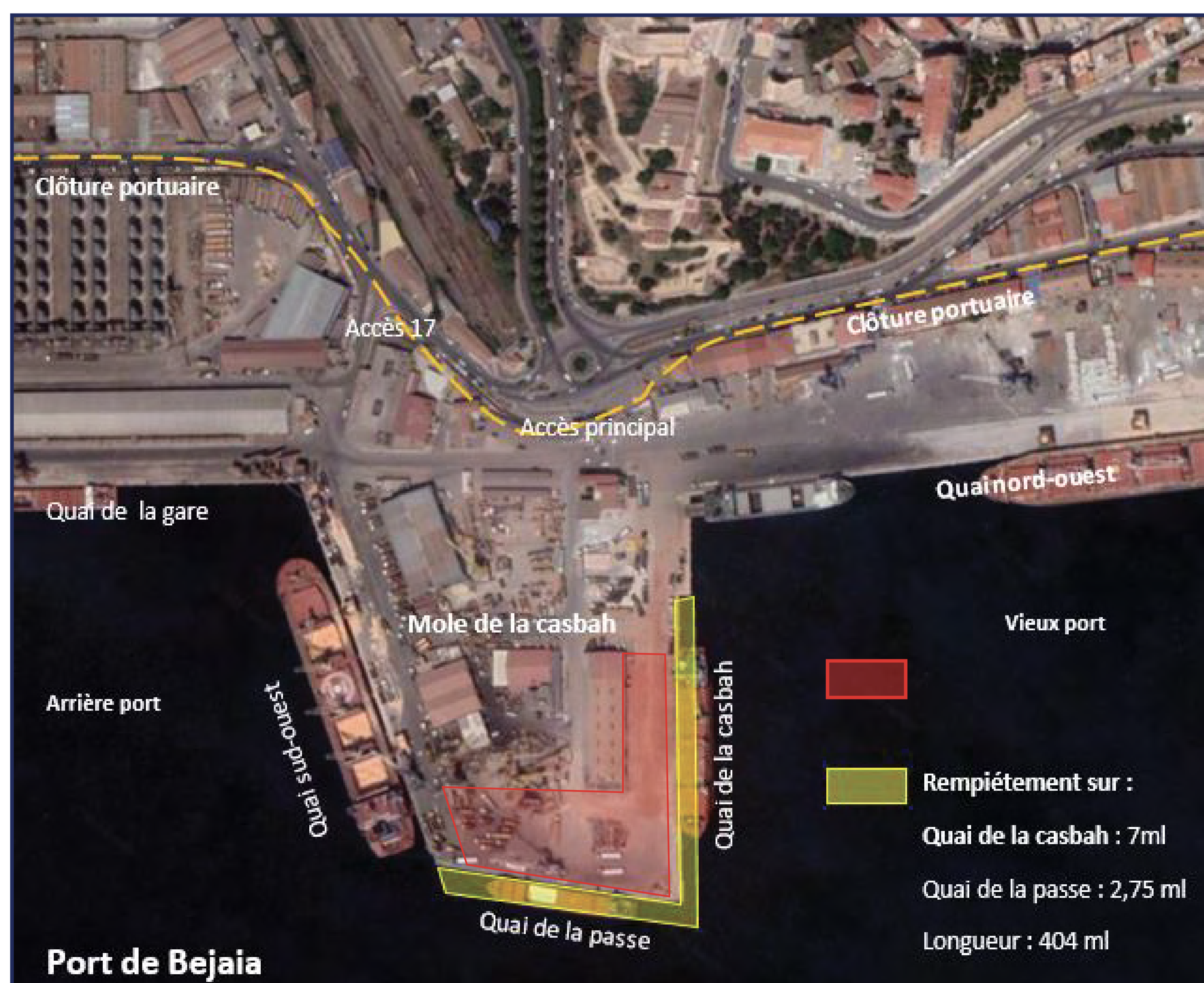
Plan de masse du site d'intervention

L'objectif principal de ces travaux étant l'entretien, la préservation et le renforcement de l'infrastructure existante, ce projet permettra également l'augmentation de la capacité de stockage des marchandises et l'amélioration de la capacité d'exploitation.